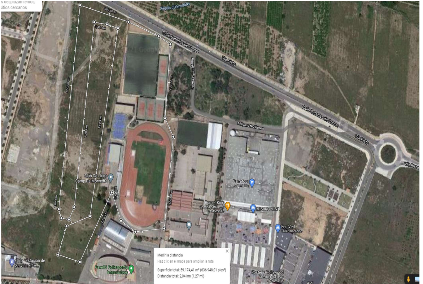
CIRCUITO A 2000M