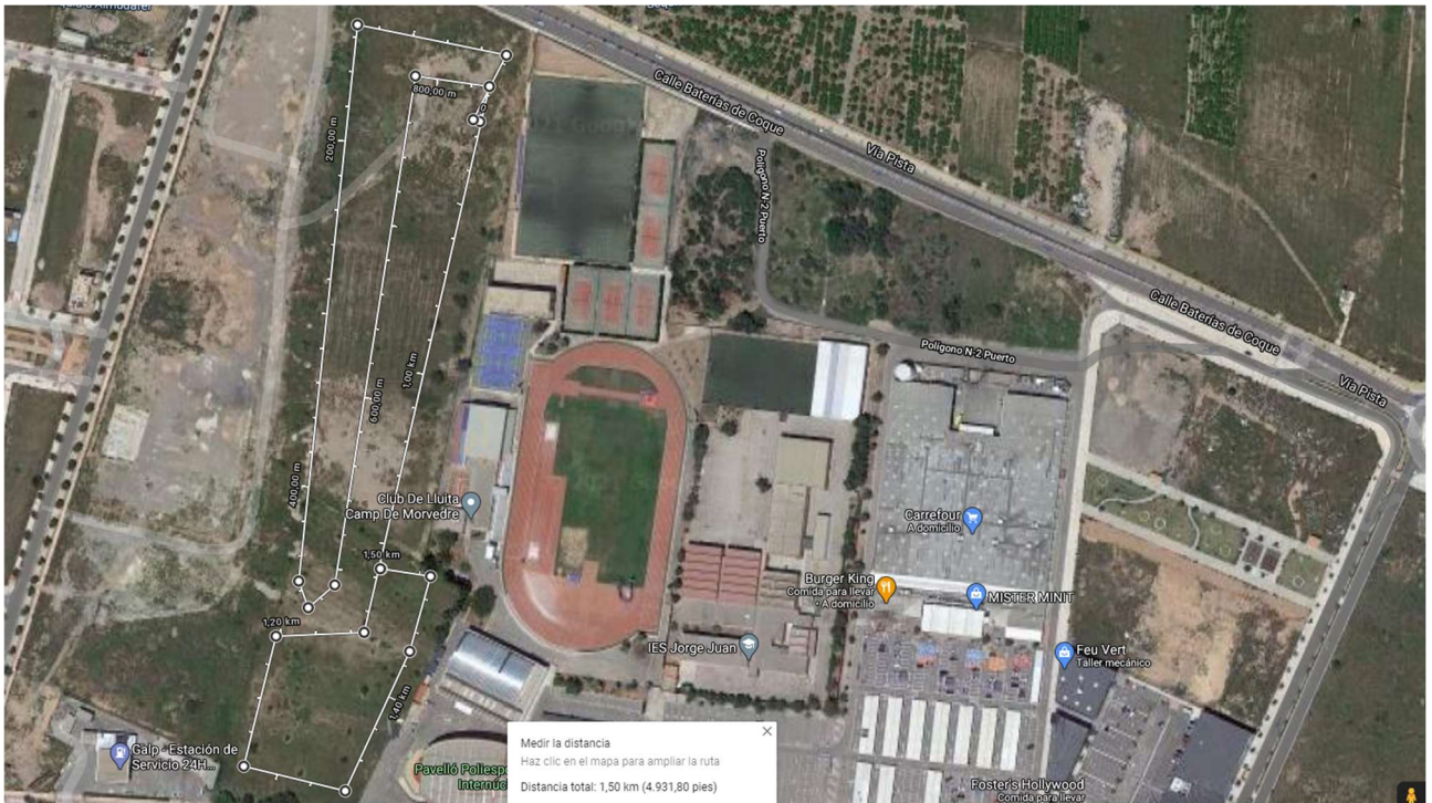
CIRCUITO B 1500M