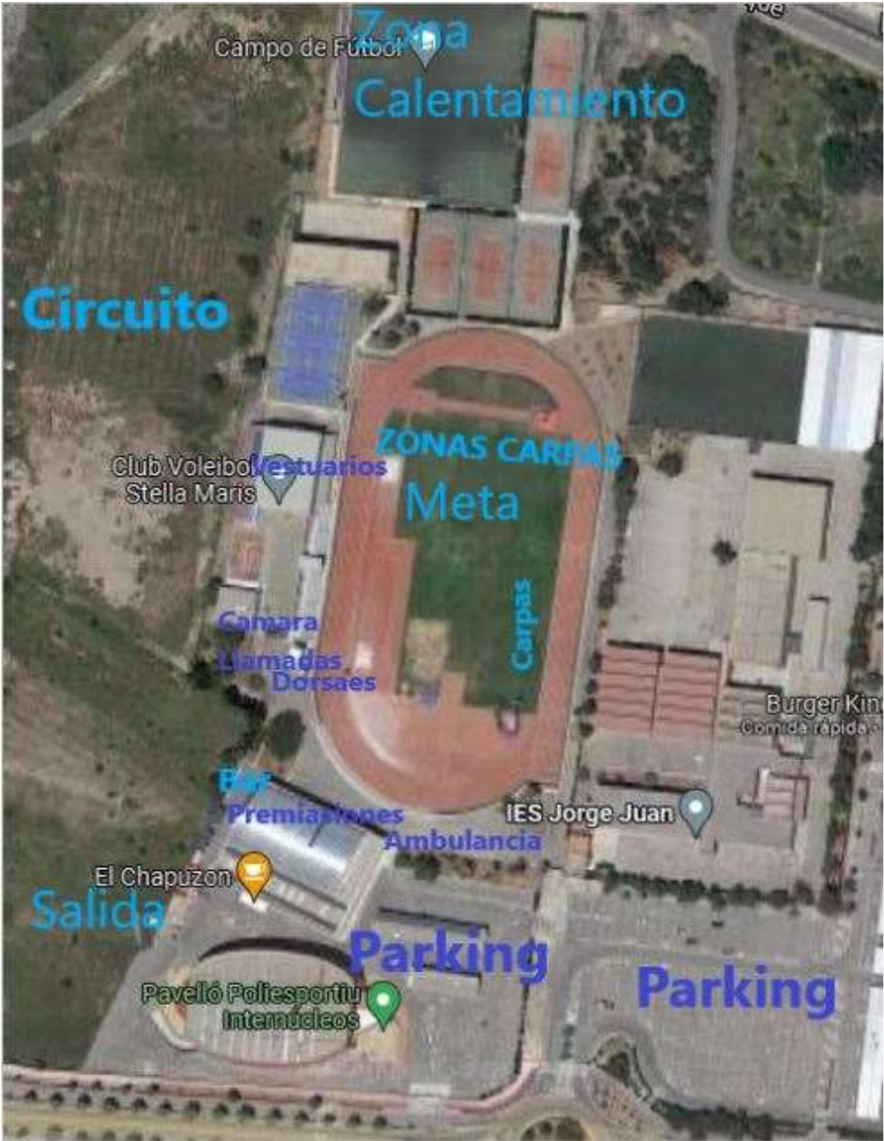
ZONA DE SERVICIOS