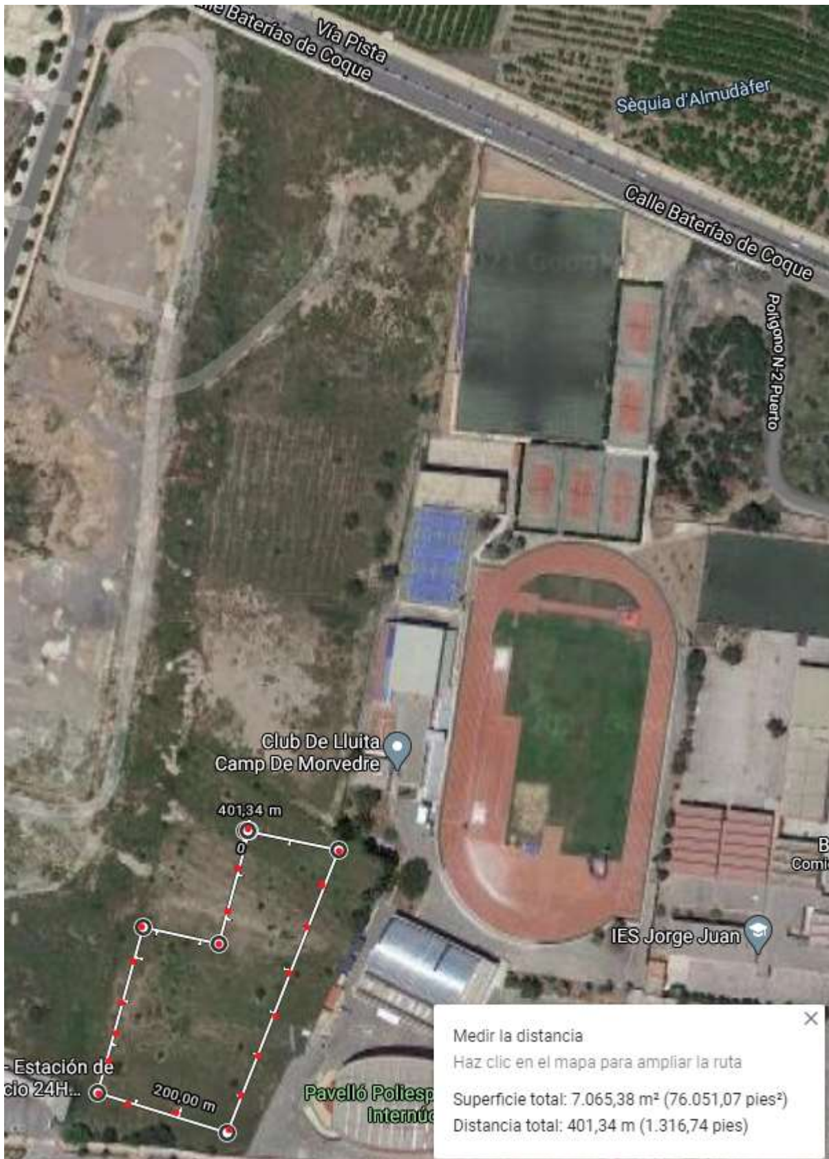
CIRCUITO C 400M