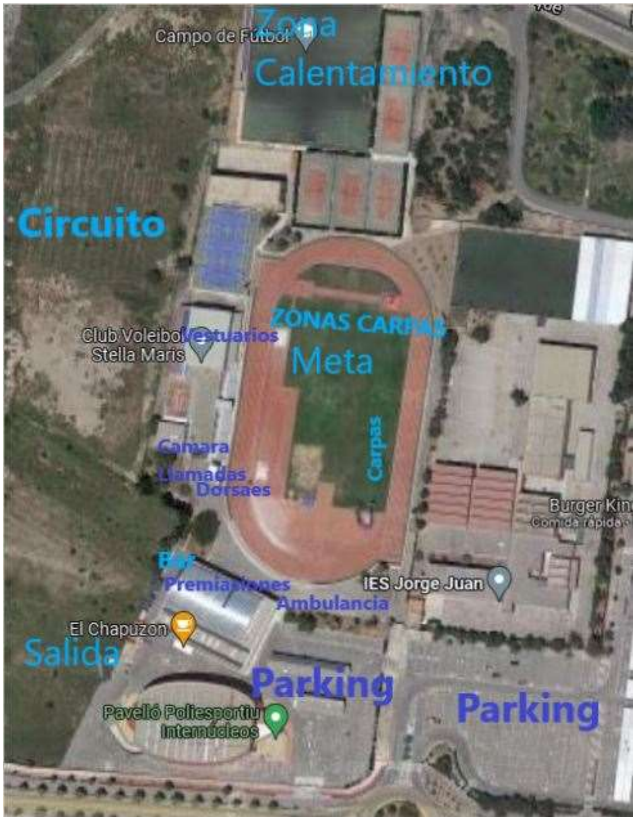
ZONA DE SERVICIOS