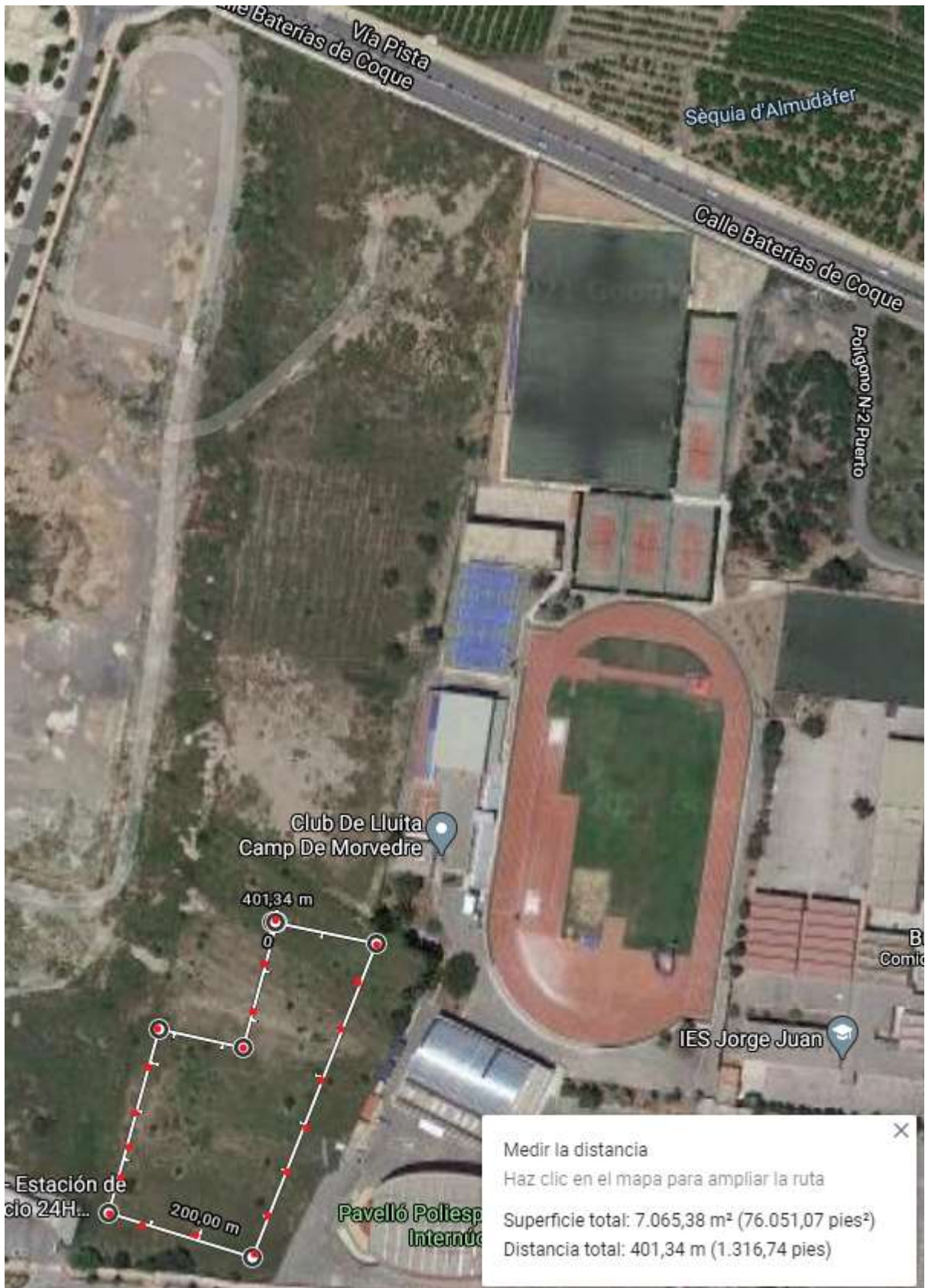
CIRCUITO C 400M